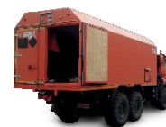
Мобильные установки по изготовлению патронированного ВВ