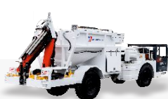
Подземные смесительно-зарядные машины